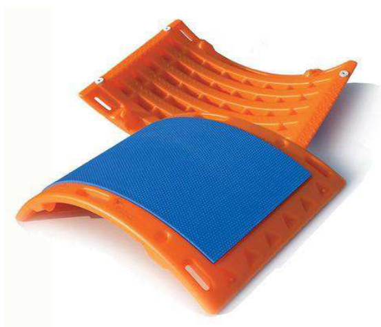
T-BOW® Orange/Blue · CLASSIC